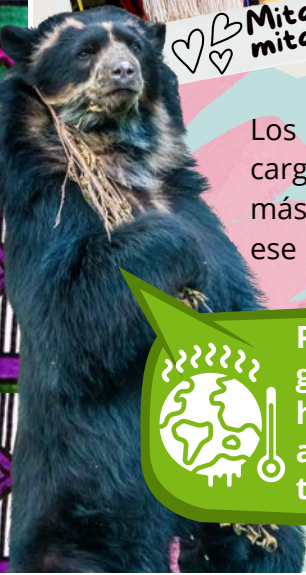
♡♡ Mitad hombre, mitad oso...