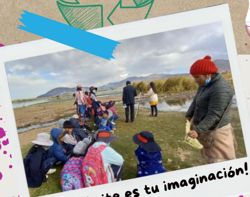
El límite es tu imaginación!