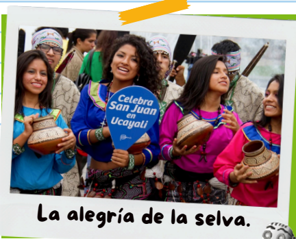
La alegría de la selva.

El mes de junio es de festividad. Nuestra región realiza diferentes actividades como: concurso de danza amazónica (pandillada), expo ferias, concurso al mejor juane, concurso de la señorita San Juan, etc. En las instituciones educativas también celebramos la fiesta de San Juan con degustación de juanes y con el concurso al mejor juane.