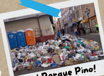
¡En el Parque Pino!