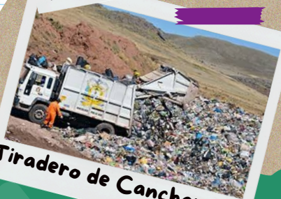
¡Tiradero de Cancharani!