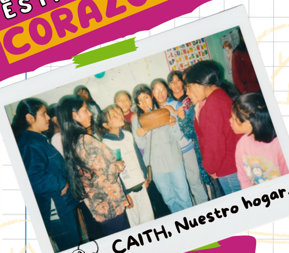
CAITH, Nuestro hogar.