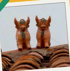
Protectores taurinos del hogar.

Según la investigación, los primeros toritos de Pucará no eran como ahora los vemos, sino eran con el cuerpo alargado, sin adornos, sólidos y sin quemar muy parecidos a las Qqonupas (figuras de llamas, alpacas que elaboraban los artesanos antiguamente). Los toritos eran comprados por los cusqueños en la feria de Pucará, y llevados a sus pueblos de origen para las diferentes actividades, rituales y buenos augurios.